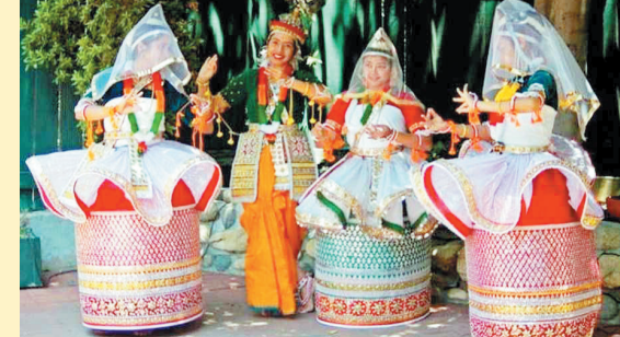
വൈഷ്ണവ വിശ്വാസം വളർന്നപ്പോൾ മണിപ്പൂരി നൃത്തത്തിന് വൈഷ്ണവമായ മാറ്റം ഉണ്ടായി. ശൈവസ്വാധീനം വിട്ട് മണിപ്പൂരി വൈഷ്ണവ